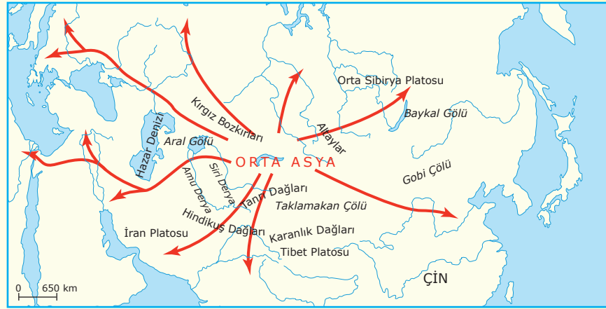
Orta Asya Türk Göçleri Haritası

Horasan'a gelen Oğuz Türkleri, bölgenin iki önemli gücü olan Karahanlılar ve Gazneliler arasında sıkışınca, kendilerine daha uygun yerler bulmak amacıyla Tuğrul ve Çağrı Beyler öncülüğünde Anadolu'ya keşif amaçlı seferler düzenlemişlerdir.