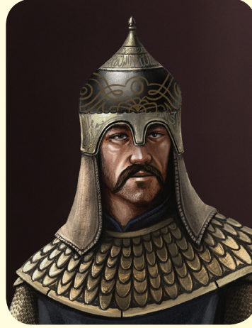
Sultan Alp Arslan

Böylece Anadolu'da I. Beylikler Dönemi başlamıştır. Bu beylikler Anadolu'nun Türkleşmesine, İslamlaşmasına ve bayındır hale gelmesine önemli katkılar sunmuşlardır.