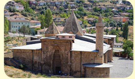
Divriği Ulu Cami (Sivas)