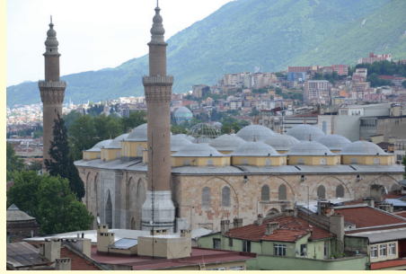
Ulu Cami (Kayseri)