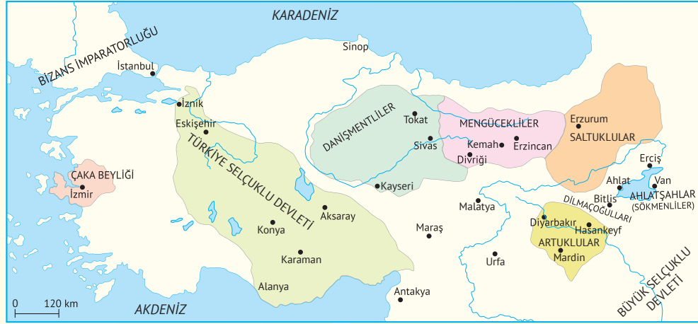
Türkiye Selçuklu Devleti ve Anadolu Beylikleri

Böylece Anadolu'da kurulan ilk Türk beylikleri ve Türkiye Selçukluları ile Anadolu'da Türk hakimiyeti kalıcı hale gelmiştir.