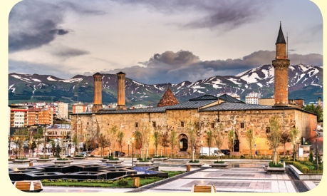
Ulu Cami (Erzurum)